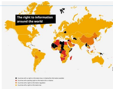
Graphique datant de 2022 extrait du site article 19 (voir sources)

Commenté [WL1]: Source exacte du graphique